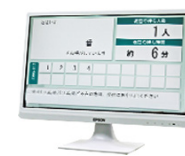
液晶ディスプレイ