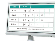
液晶ディスプレイ