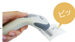
番号札をスキャンして受付